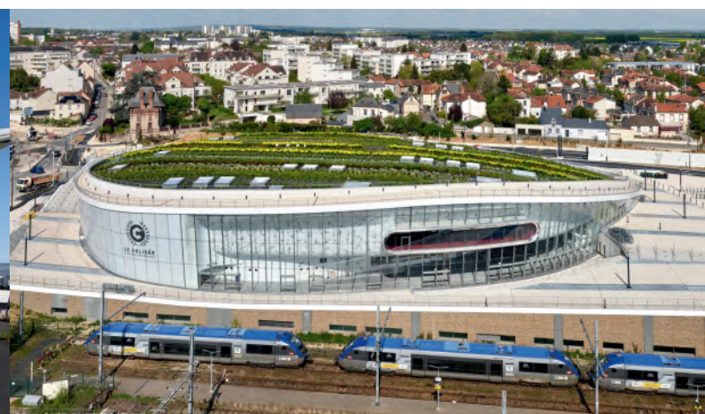
Le Colisée – Chartres (28)

Maître d'ouvrage : Communauté d'agglomération de Saint-Etienne Métropole | Construction : Renaudat Centre Construction (Charpente) | Architecte : Foster and Partners