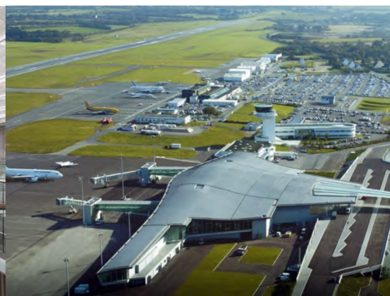
Aéroport de Brest-Bretagne (29)

Maître d'ouvrage CCI de Brest; Architectes : drlw