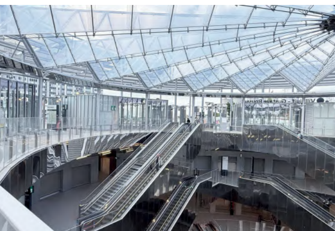
Gare de Villejuif :

Maître d'ouvrage CCI de Brest; Architectes : drlw