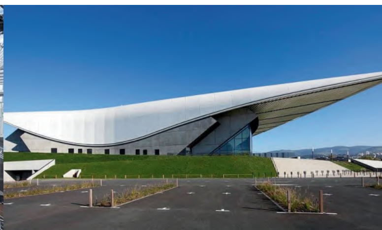
Zenith de Saint-Etienne (42)

Architecte : Dominique Perrault Constructeur métallique : Waltefaugle Bâtiment