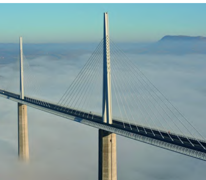
Viaduc de Millau (12)

À travers « Génération Métal », le SCMF affirme une ambition claire : faire des 140 ans non seulement un anniversaire, mais un levier de projection collective pour la filière de la construction métallique.