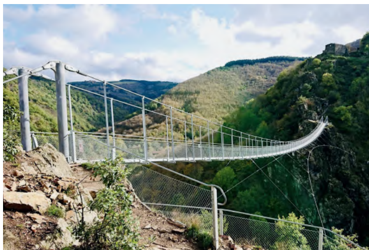
Passerelle piétonne d' Hautpoul (81) SCOP Cabrol

Tout au long de l'année 2026, une série d'événements, de publications et d'actions de communication rythmera cette célébration, avec un point d'orgue lors du congrès annuel du SCMF à la Cité de l'architecture et du patrimoine à Paris qui réunira bien entendu les adhérents et exceptionnellement des architectes, des bureaux d'études et de nombreux prescripteurs, organismes représentatifs et partenaires de la filière.