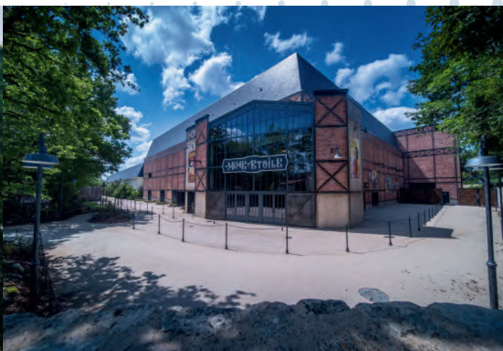
Le Mime et l'Étoile Structure métallique : Briand Métal