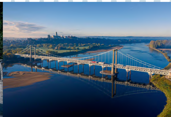
Sécurisation Pont de Varades (44) Constructeur métallique : Baudin Chateauneuf